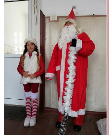
Гости на ОУ "Христо Ботев" - с. Българене за поредна година бяха Дядо Коледа и неговата помощничка - хубавата Снежанка. Те поднесоха подаръци на всички деца.